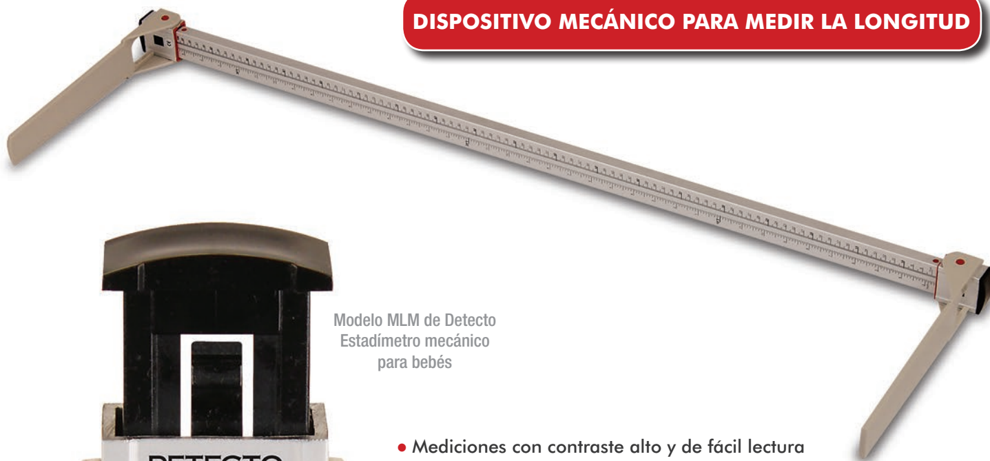
Modelo MLM de Detecto Estadímetro mecánico para bebés

DISPOSITIVO MECÁNICO PARA MEDIR LA LONGITUD